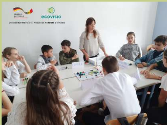
Игра #KeepCool в школах

Вы учитель(ница), ученик(ца), мама-папа-бабушка школьника или школьницы, молодёжный(ая) работник(ца)? Вас беспокоит состояние окружающей среды и изменения климата? Хотели бы вы, чтобы эти темы рассматривались более серьезно в вашем сообществе? Мы можем прийти к вам на помощь с игрой-симулятором Keep Cool (рус: «Не горячись!»), доступной на русском, румынском и английском языках! Подробнее об этой возможности можно прочитать здесь .