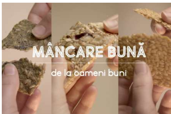
Хорошая еда от хороших людей