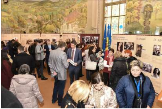
Фото-документальная выставка "Убегая от Холокоста: еврейские беженцы с Кавказа и Азии"

Данная выставка рассказала много личных историй и впервые представила архивные документы про эвакуацию евреев из восточных регионов бывшего Советского Союза в Центральную Азию во время Второй Мировой Войны. Выставка проводилась с 25 по 29 июля в Artcor. Переходи на Facebook страницу выставки , чтобы увидеть другие фотографии и репортаж TVR.